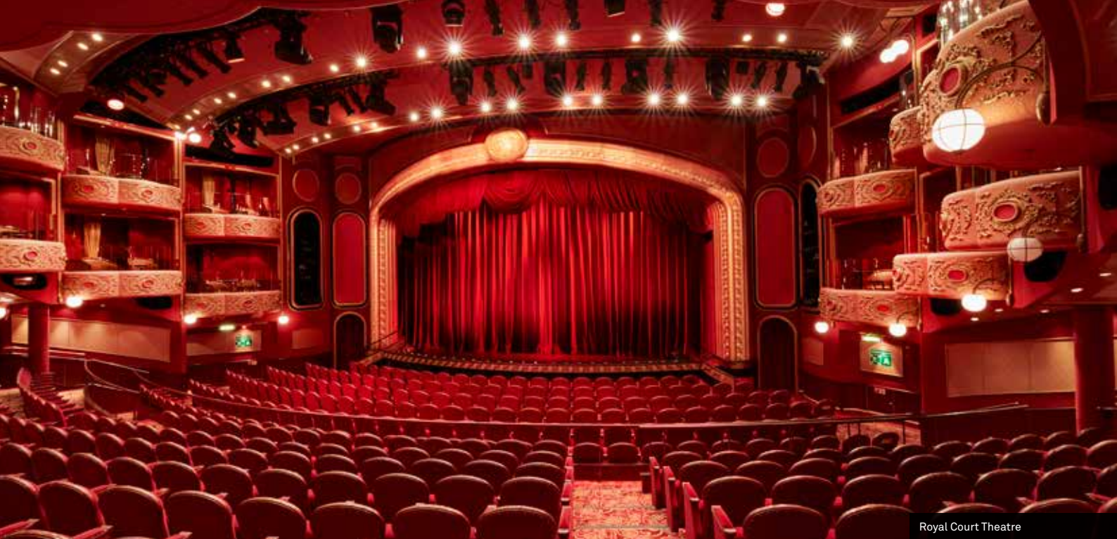
Royal Court Theatre