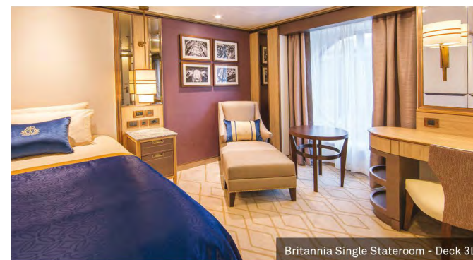
Britannia Single Stateroom - Deck 3L

Las imágenes son ilustraciones y pueden estar sujetas a modificaciones