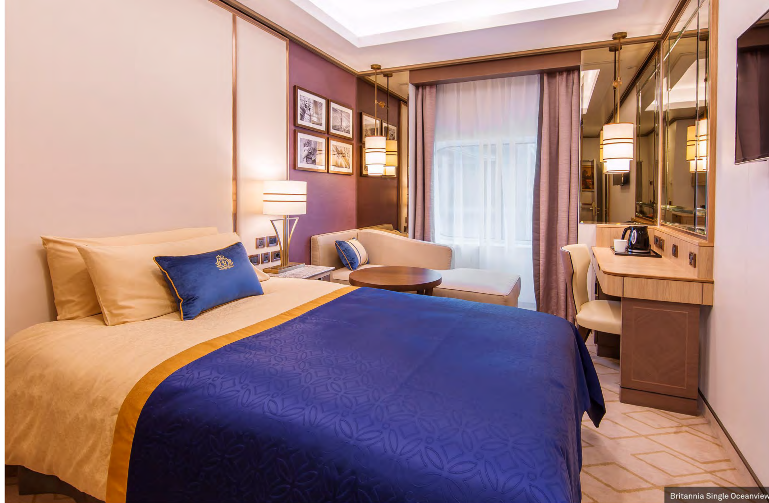
Britannia Single Oceanview

Los pasajeros que deseen viajar en un camarote doble, pueden pagar el suplemento adicional.