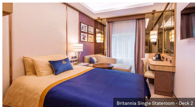
Britannia Single Stateroom - Deck 2