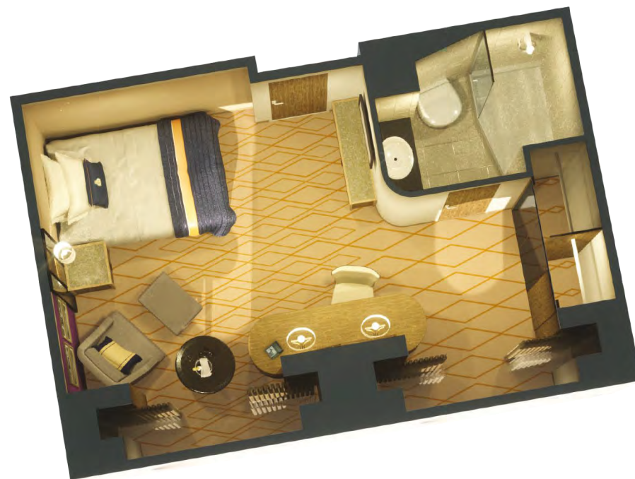
KC Exterior Individual

Estos camarotes ofrecen una decoración moderna y elegante con detalles que hacen tributo al art deco del icónico Queen Mary