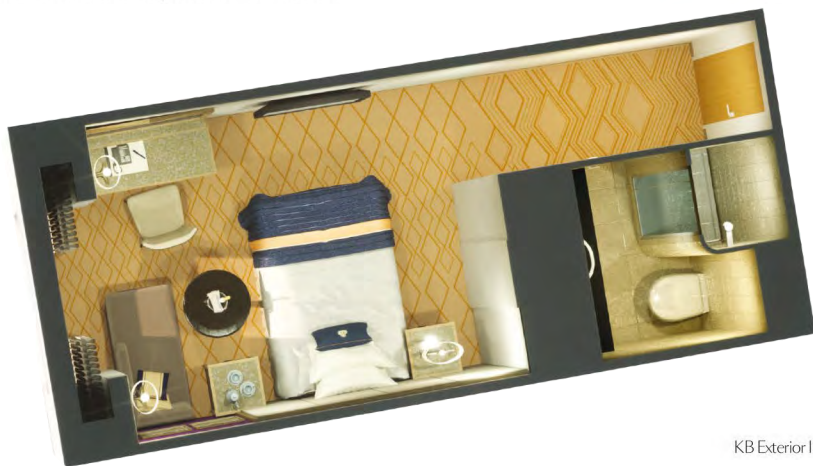
KB Exterior Individual